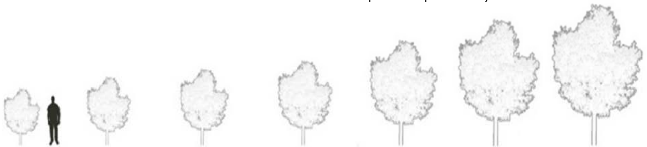
Figuur 5: Van links naar rechts: sterkere groei-kracht van de onderstam leidt tot een grotere boom. Voor klassiek fruit, met name appel en peer, zijn er veel opties mogelijk met grote verschillen in groei-kracht.

Herken kwaliteitsplantgoed. Kijk bij kale wortel of de wortels geen vreemde vergroeiingen (zoals wortels die in elkaar gegroeid zijn) of beschadigingen hebben. De wortels mogen ook niet droog zijn. Een kluit moet goed en stevig doorworteld zijn en niet uit elkaar vallen. Uiteraard moet de boom of struik er verder gezond en vitaal uitzien (geen beschadigingen of slechte plekken op het hout).