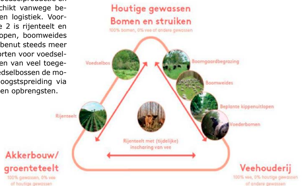
Figuur 3: Verschillende agroforestry systemen, hun verhouding tot akkerbouw/veehouderij en de mate van de toepassing van houtigen (Masterplan Agroforestry, 2020).