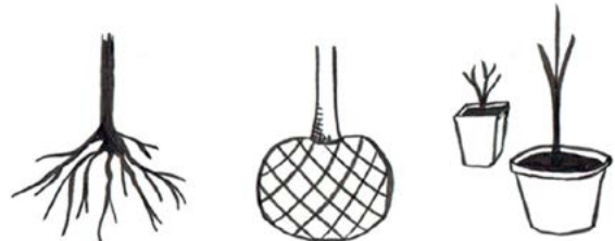
Figuur 4: Van links naar rechts: kale wortel, kluit, pot.

Plantgoed is verkrijgbaar met kale wortel, in kluit of in een pot. Elke vorm heeft voor- en nadelen. Zo is plantgoed met een kale wortel gemakkelijker in grote aantallen te vervoeren (in bundels) en slaat dit het snelste aan op je eigen bodem. Aan de andere kant is kale wortel tijdens transport en opslag een stuk gevoeliger voor uitdroging. Plantgoed in (draad)kluit zijn voornamelijk grotere maten of groenblijvende struiken. Het voordeel is dat dit de wortels goed beschermt, al is het moeilijker om na het planten goed water te geven bij de wortels, wanneer niet met een druppelaar wordt gewerkt. De wortels van plantgoed in pot zijn ook goed beschermd. Let er wel op dat de wortels goed zijn gevormd. Het komt vaak voor dat planten in pot worden aangeboden waarin de wortels niet goed gevormd zijn: te weinig doorworteling, of juist te veel, waarbij de wortels in de pot rondgroeien. In dat geval kan het raadzaam zijn om de wortels voorzichtig uit elkaar te trekken waarbij je moet opletten dat de wortels niet beschadigen.