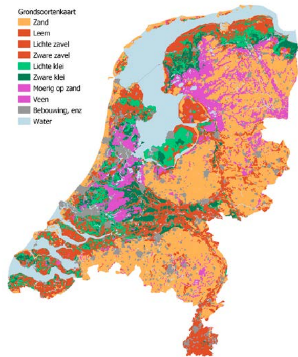
Figuur 2: Grondsoorten in Nederland.